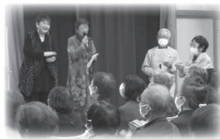
最後は皆で「秩父恋しや」合唱♪