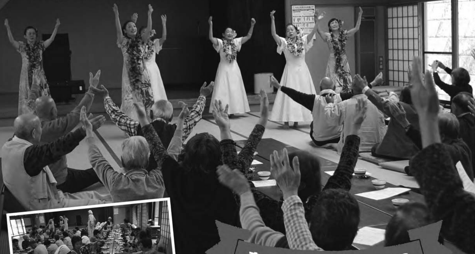
フラサークル hie hieのみなさん