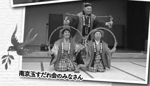
南京玉すだれ会のみなさん

横瀬町赤十字奉仕団はボランティア活動の一つとして、年3回ひとり暮らし高齢者向けの食事サービスを行っています。12月9日(金)はボランティア団体「フラサークルhiehie」によるフラが披露され、とても華やかなひとときになりました。また、3月13日(月)にも同じくボランティアさんによる南京玉すだれや相撲甚句が披露され、楽しいひとときを過ごしました。その後の食事会は、奉仕団員自らが彩りや健康面に配慮した料理を囲みながら交流しました。